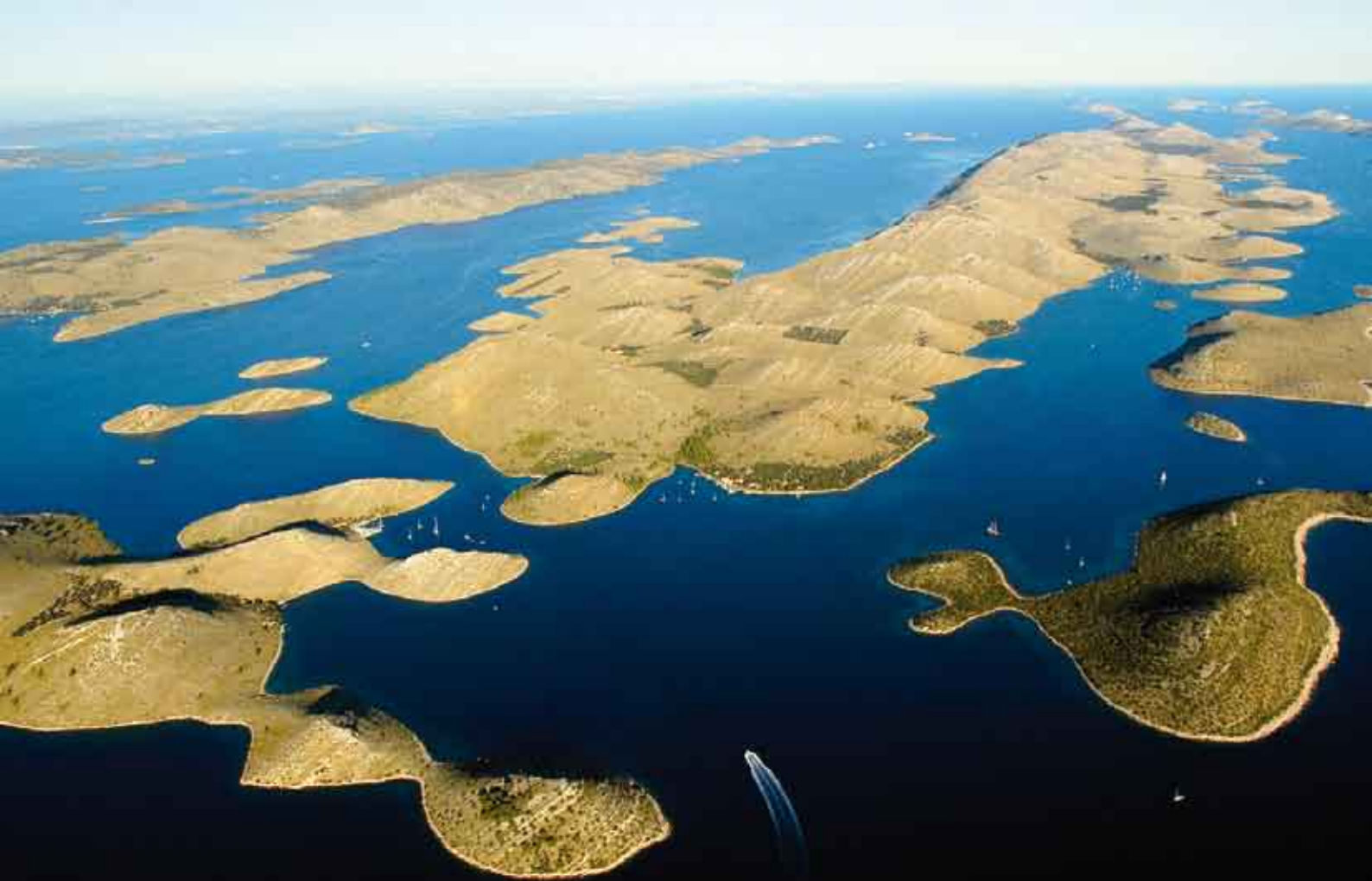
Panorama Kornata - s ulazom u NP (pozicija uz jedrilice)