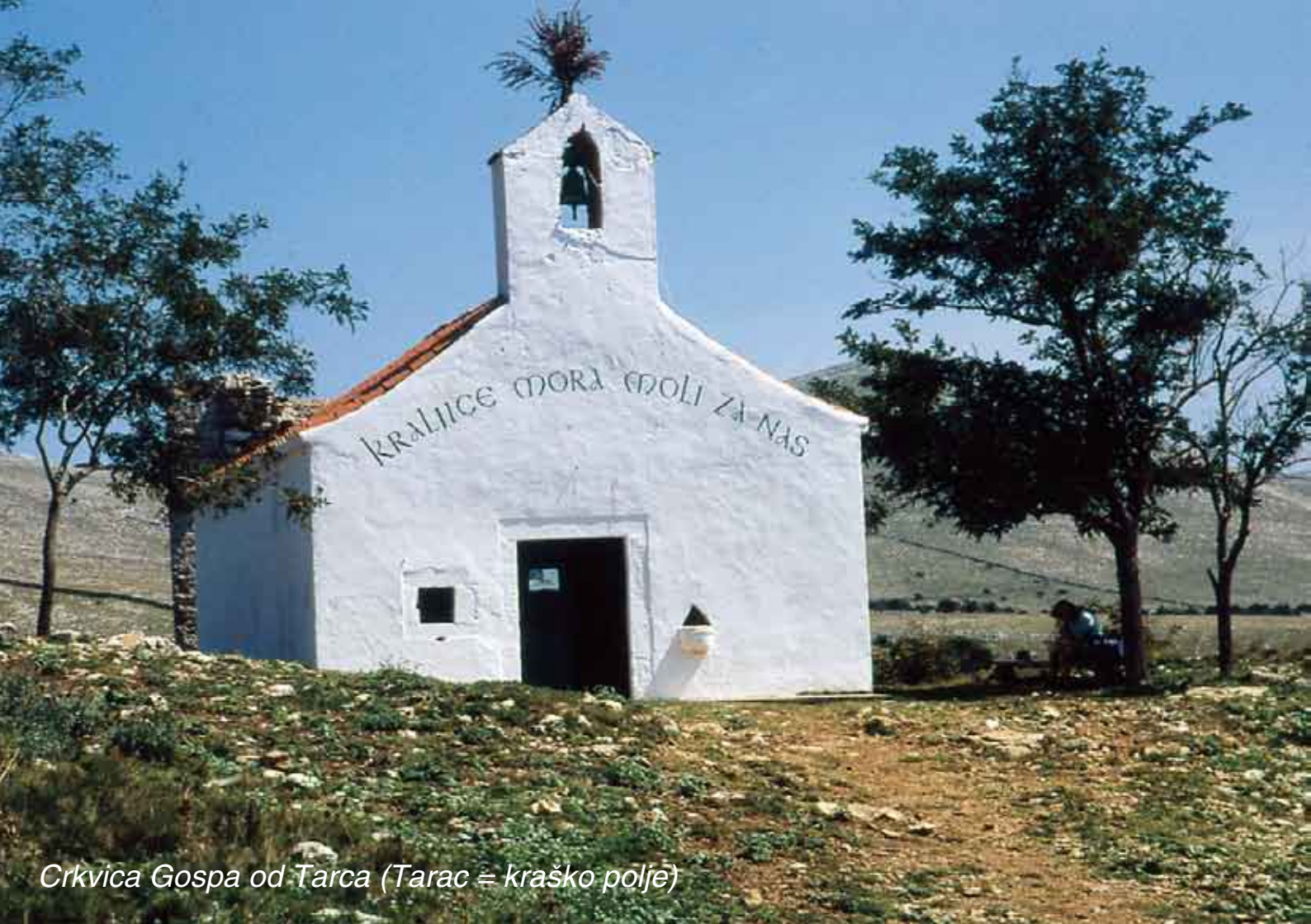
Crkvice Gospa od Tarca (Tarac = kraško polje)