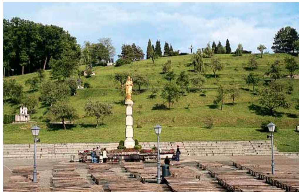
Najveći molitveni prostor na otvorenom u Hrvatskoj - u pozadini Kalvarija

Naselje Bistrica spominje se u dokumentima od 1209.g. Njegova najvažnija godina je, međutim, godina 1684., kad je u mjesnoj crkvi ispod kora otkriven i otkopan kip Majke Božje s Isusom u naručju (kip je davno tu sakriven u strahu od pristiglih osvajača Turaka). Pedesetak godina kasnije, 1731. g., hrvatski biskup Branjug posvećuje novu crkvu Blaženoj djevici Mariji (do