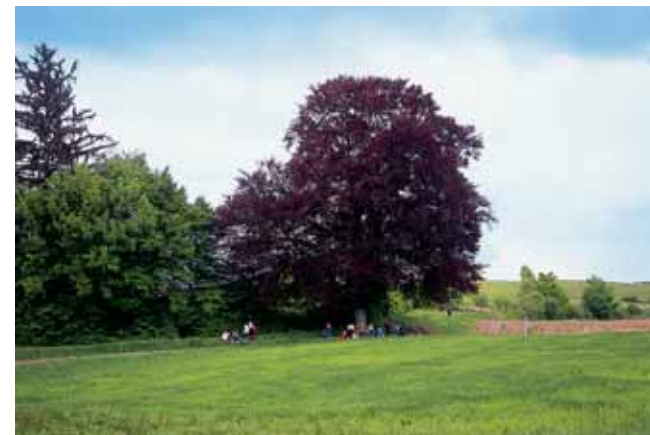
Impozantna bukva s tamno crvenim lišćem i grupom planinara na odmoru