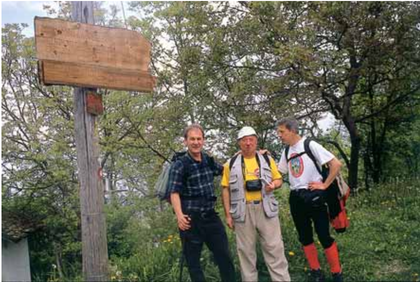
Jedna od tabli s šaljivim natpisom (središnja dionica - Žuta šetnica)