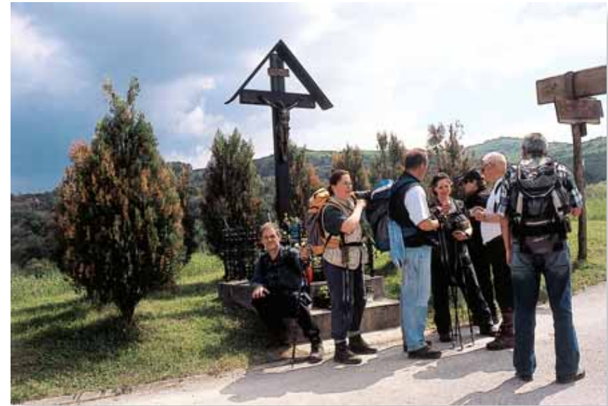
Jedna od osam kontrolnih točaka na obilaznici