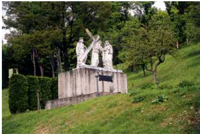
Prva postaja na Kalvariji