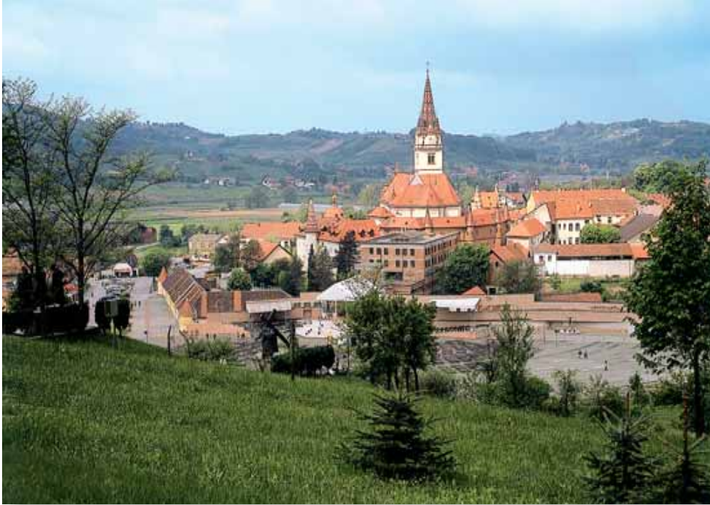
Jedan od pogleda na centar Marije Bistrice - s obilaznice