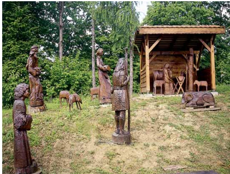
Park skulptura nedaleko od centra grada (motiv jaslica)