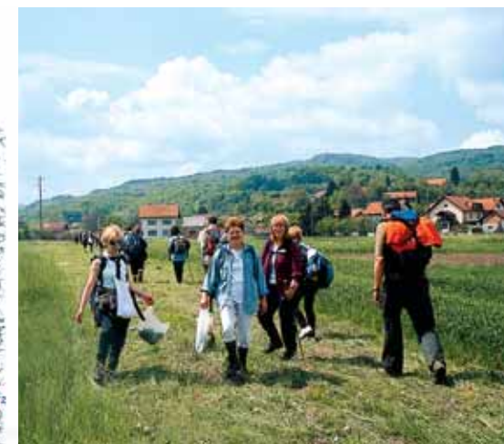
Dio puta vodi i kroz polje