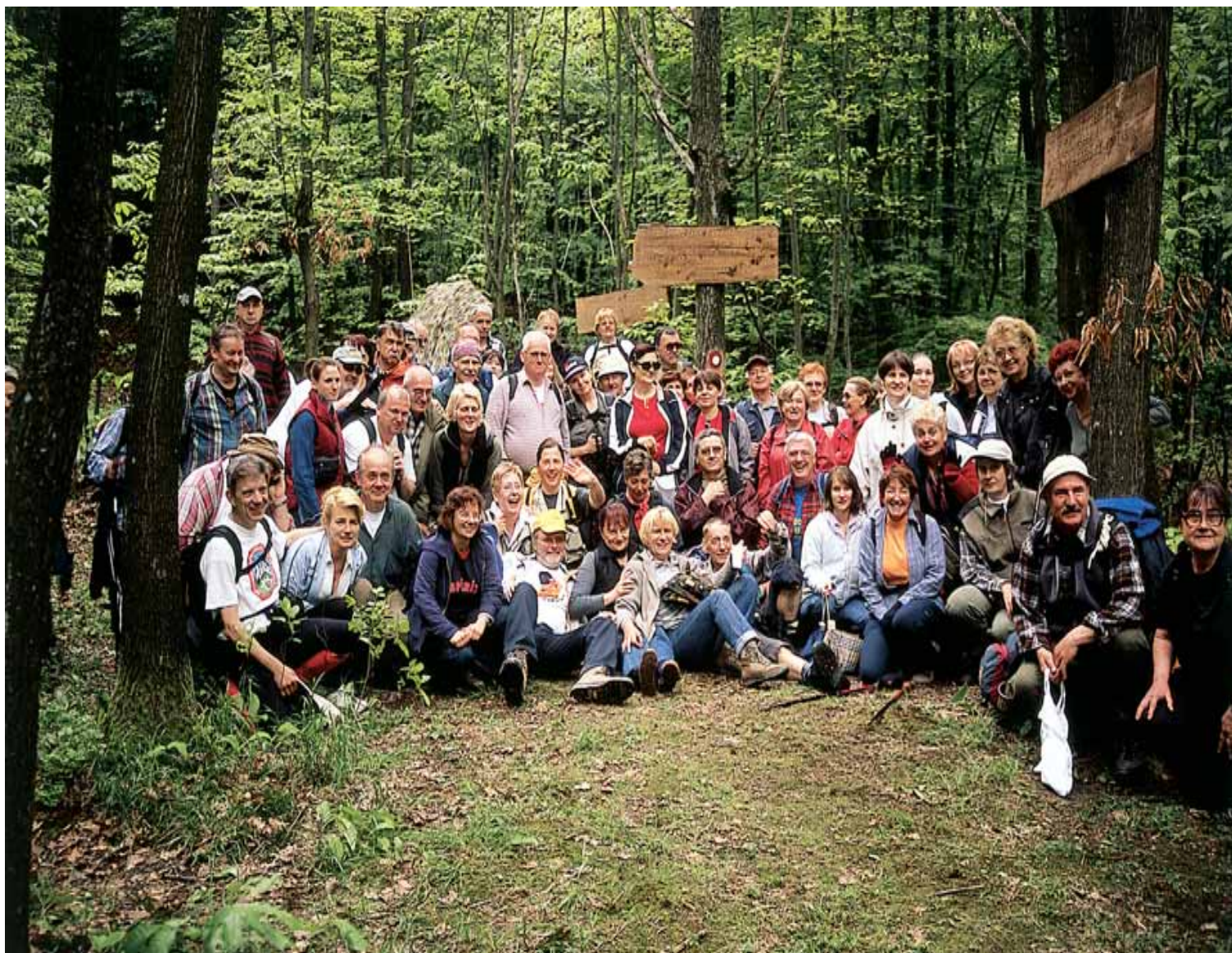
Društvo Kapela na glavnom odmorištu obilaznice - uz žesticu i vino domaćina