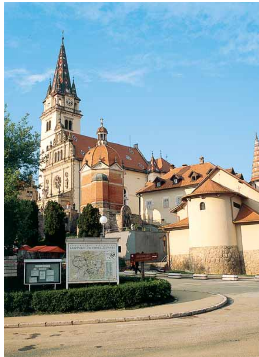
Glavna crkva u Mariji Bistrici