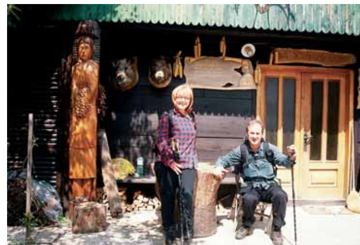
Izuzetno lijepa klet sa bogato ukrašenim pročeljem (+ autor s družicom)