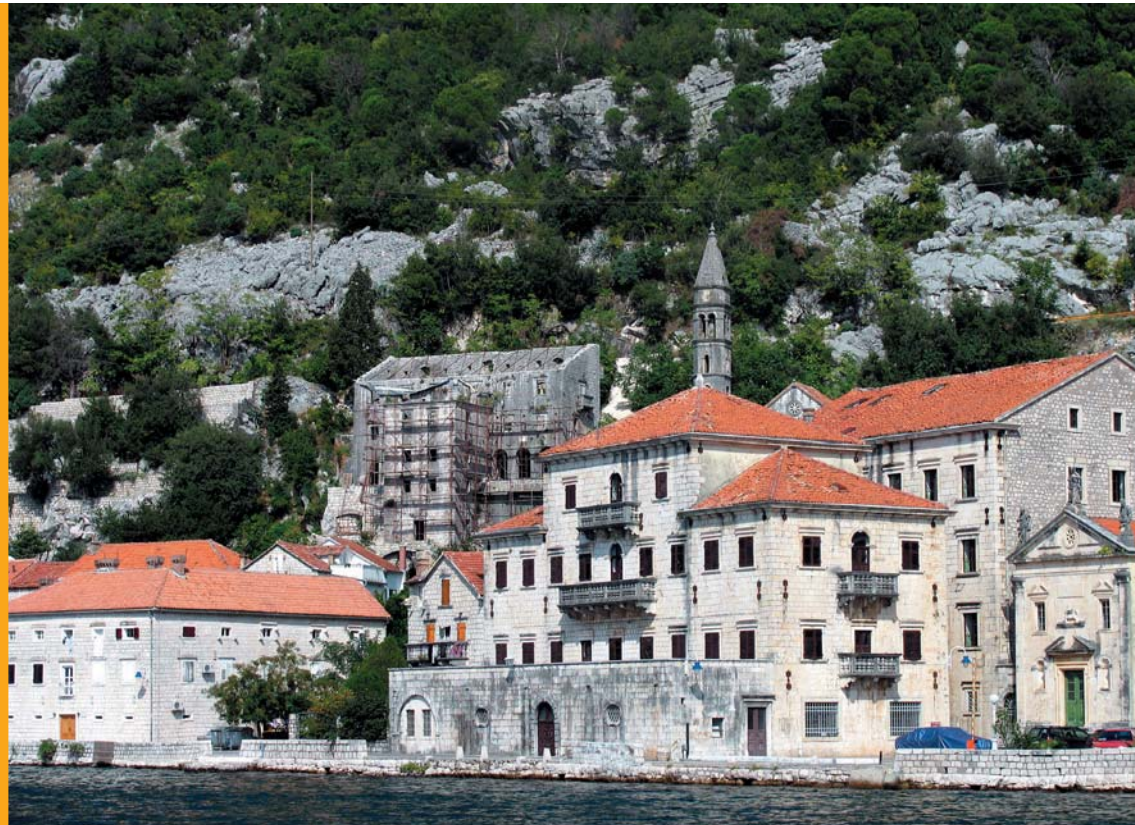
Perast čeka novu šansu

stom. Grad je lijep. Nekoliko malih trgova na kojima su nagurani stolovi i suncobrani, koji nagrđuju i skrivaju arhitekton-