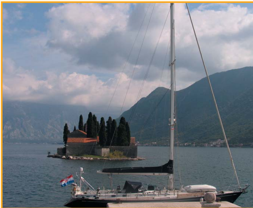
Samostan na sredini zaljeva

Ispred Kotora se prvo vidi veliki cruiser, a takvi posjećuju ovaj grad svakog dana u sezoni. Stari grad je stisnut među zidine koje se protežu do vrha gotovo okomitih klisura uzdignutih nad mje-