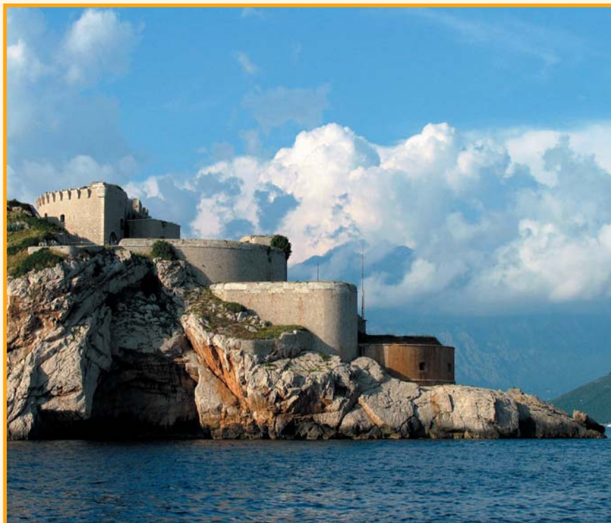
Najjužniji dio Hrvatske

svijetu. Restoranska ponuda je korektna, a mi smo izabrali, kako su nam rekli, najbolji roštilj u gradu, u restoranu Galerija.