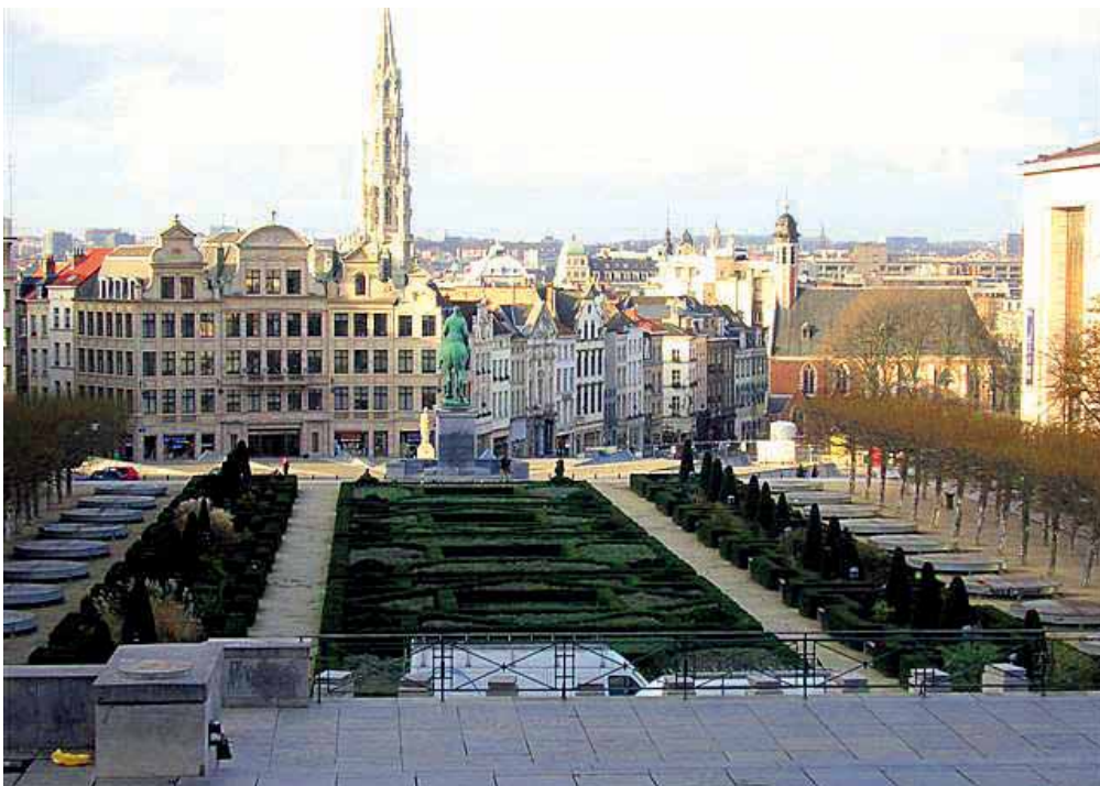
Park u jezgri grada - podno Kraljevskog muzeja likovnih umjetnosti