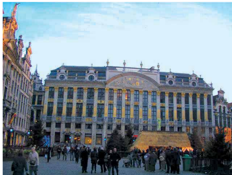
Primjer bogate arhitekture