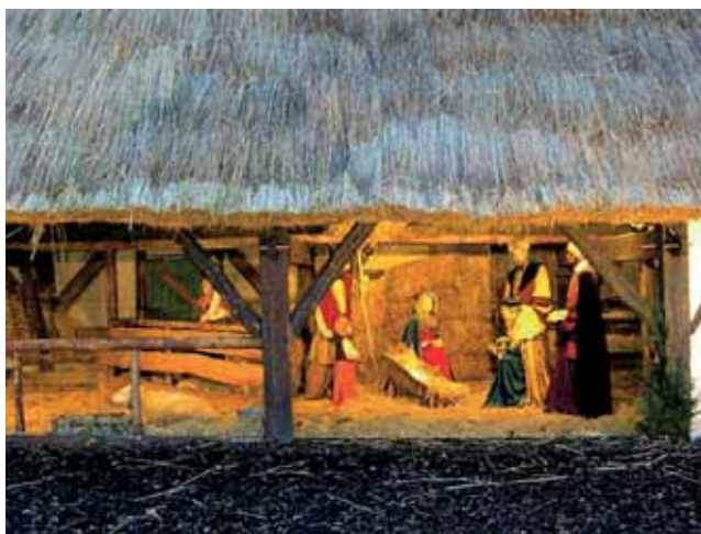
Jaslice sa figurama u veličini čovjeka

upravnog i poslovnog života – sve što je u državi vrijedilo moralo se tu pokazati. Primjer je to romantičnog srednjovjekovnog trga, gotičkog i baroknog stila gradnje. Mnogobrojnim posjetiteljima Grand Place je jako neobičan i zanimljiv. Prvo, on na središnjoj plohi nema karakterističnog kipa kao što ga imaju većina trgova glavnih gradova Europe (i naš Zagreb, naravno). To mi je bilo malo čudno – pa imaju i Belgijanci nekog zaslužnog iz povijesti da ga posebno počaste. Ono što impresionira svakog tko prvi put posjeti taj trg su palače (takve zgrade se moraju tako nazvati) koje se protežu duž svih strana trga – te su zgrade visoke dva, tri ili četiri kata, kako koja.