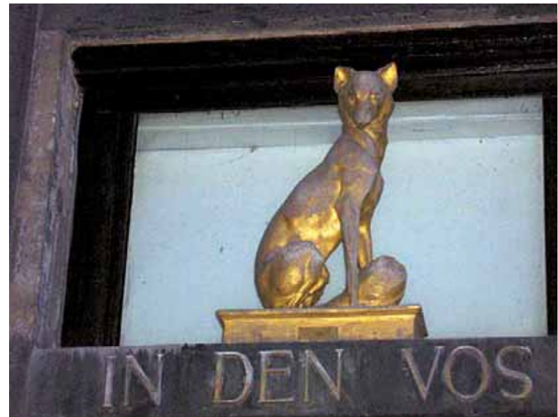
Lisica - simbol na zgradi Ceha trgovaca galanterijom