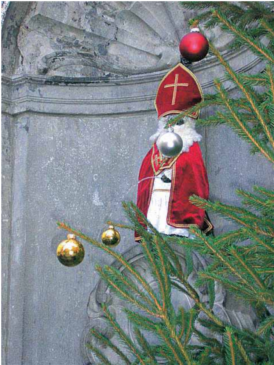
Kip popularnog Manekenna Pisa u prigodnom božićnom odjelu