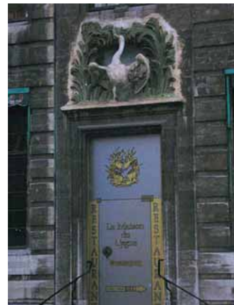
Labud - simbol na zgradi Ceha mesara