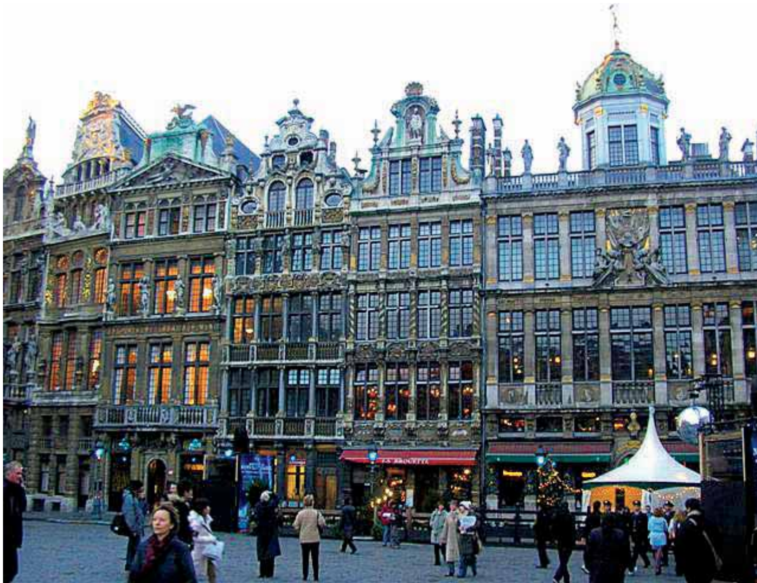
Središnji trg - Grand Place - prva s desna je velika palača Ceha pekara