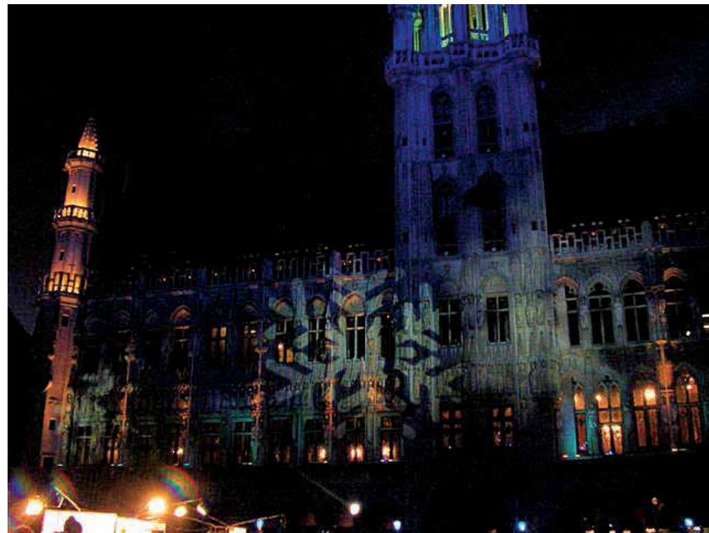
Igre svjetlom (light show) na fasadi Gradske vjećnice (zamjećuje se obris pahulje)

Šoping, bar neki mali, je nezaobilazna stvar svakog putovanja. Imate sve šanse da se iz Bruxellesa ne vratite kući praznih ruku. Važna takva točka je ulica Rue Neuve, dio pješačke zone, ne daleko od opisanog Grand Placea. Tamo ćete naići na sve poznate europske modne kuće. Za one koji prate visoku modu, dobra ulica je Avenue Louise (ulica dizajnerskih dućana). Ono što nisam očekivala je bogata ponuda fino izrađene kožne obuće. Podsjetila sam se starih vremena kad