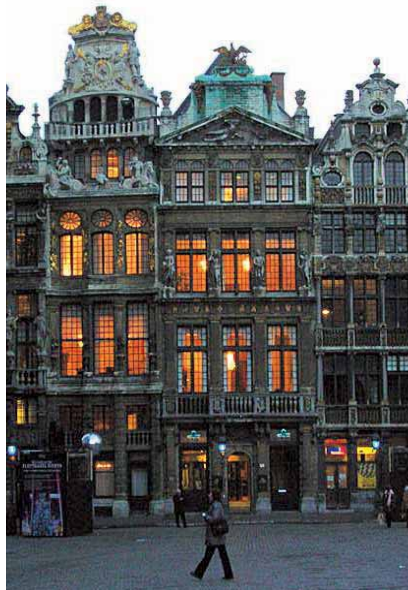
Na glavnom trgu cehovske palače se natječu u raskoši

Glavni trg i središte Bruxellesa je Grand Place, gdje se nekad odvijao pretežni dio