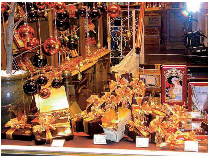
Izlog slatkog dućana