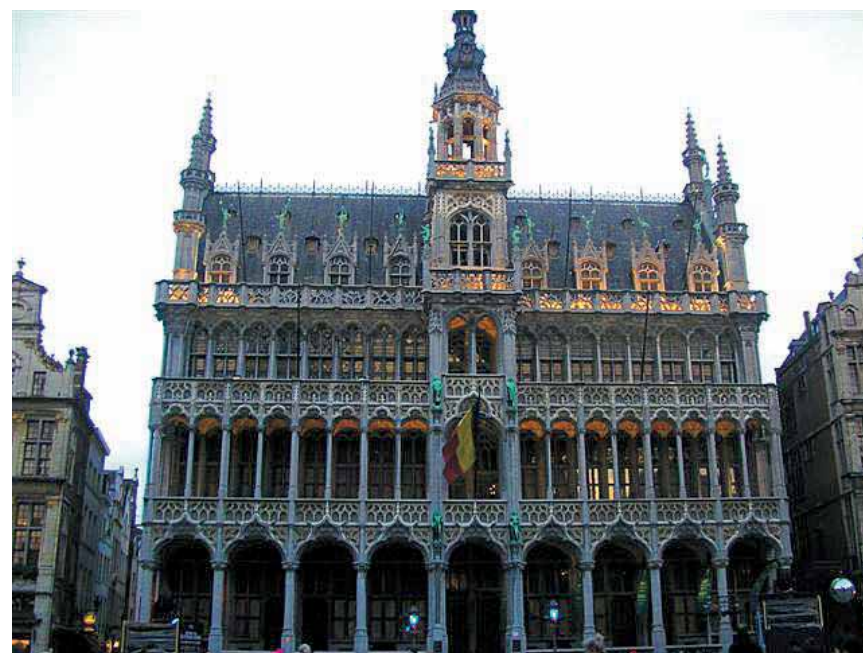
Kraljevska palača - sada Muzej grada