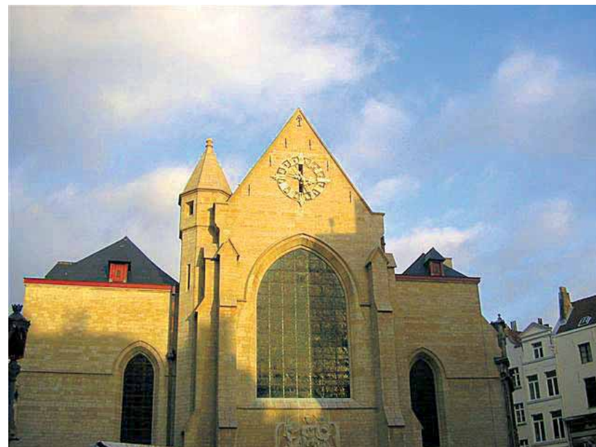
Crkva Sv. Nikole