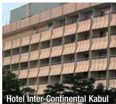
Hotel Inter-Continental Kabul

Samo se za vikendom, uz dosta gostiju jednostavno po nekoliko mladića ustane i spontano započnu plesati uz taktove tradicionalne glazbe. Ples je nalik na morešku ili šotu, ali polaganog ritma prema brzem. Za to vrijeme djevojke, uređene i lijepe držanja, sjede na mjestima i na kraju zapljeću, ali ni pomisli da i one igraju. Odšetao sam sa svojom domaćicom do Ball Rooma, gdje se održavala tradicionalna afgan-