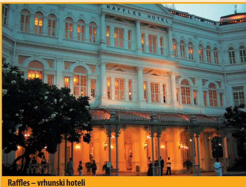
Raffles – vrhunski hoteli

Što vidjeti? Kinesku četvrt s malim prodavaonicama suvenira, ljekarnama tradicionalne kineske medicine (zmije, škorpioni i ostale 'ljekovite' životinje), zoološki vrt i park orhideja, prošetati Orchard Roadom. Gastronomija je najbolji dio ponude. Vrhunski restorani svih mogućih svjetskih kuhinja. Novouređena riječna obala sa šetalištima i stotinama restorana na otvorenom te klubovima – središte je noćne zabave. Što kupiti? Singapur je shopping raj za one male i mršave. Brojeve iznad muškog 52 ili cipele broj 45 je teško naći. Svoje dućane tu imaju gotovo svi poznati modni kreatori i prodaju se najnovije kolekcije. Poznavatelji prilika kažu da ranije stignu ovdje nego u London. Jeftine kopije dizajnerskih kolekcija se još mogu naći, ali samo na ulicama po periferiji.