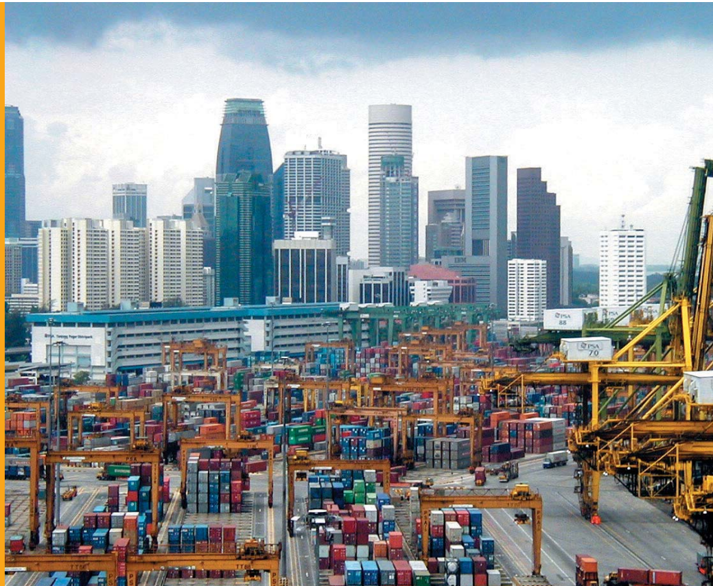
Singapurska luka jedna je od najvećih i najmodernijih u ovom dijelu Azije