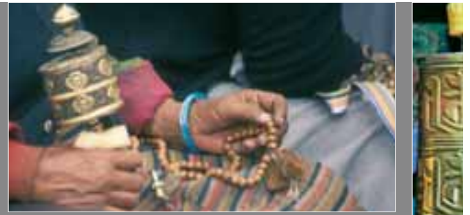
Molitva - ručni molitveni mlin, i svojevrsna krunica... Vrlo pobožni Tibetanci stalno barataju s time, a pritom izgovaraju razne mantr