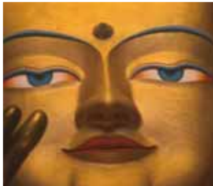
Velik kip bude od zlata

Dalai Lamina palača - Potala - prazna već pola stoljeća, svakom je Tibetancu simbol borbe za neovisnost od Kineza. Pretpostavlja se da su Kinezi predviđali dobru zaradu od turizma, pa i nju nisu srušili poput većine hramova. Duhovno središte Lhase nije Potala nego Jokhang, koji je najsvetiji i najaktivniji od svih hramova u Tibetu. Ovdje se mistična tama miješa s mirisom tamjana i hodočasnica neograničene vjere koji obilaze, hram prostirući se po tlu. Upravo ovdje se većina putnika zaljubljuje u Tibet, u toj gužvi gomila iz nekog drugog vremena i svijeta, u sred-njovjekovnoj atmosferi uličnih izvođača i