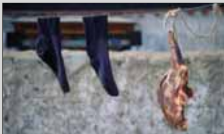
Meso se suši na suhom zraku Tibeta, zajedno s opranim rubljem...

Mlijeko se nikad ne pije, od njega se radi maslac. On se također ne jede, nego služi kao ulje, stavlja se u tsampu ili se od njega radi čaj. Čaj je posebno zanimljiv u Tibetu. Lišće crnog čaja koje se uvozi izdaleka,