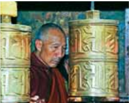
Mlinovi - molitveni kotači koji se vrte i šalju molitve u vjetar

Od 6. do 11. prosinca, u Zagrebu će se održati TJEDAN TIBETSKE KULTURE . Kulturno-humanitarni događaj obuhvaća: predavanja, izložbe, filmove i slušaonice. Redovnik iz Tibeta će demonstrirati izradu pješčane mandale. Više informacija na www.kek.hr