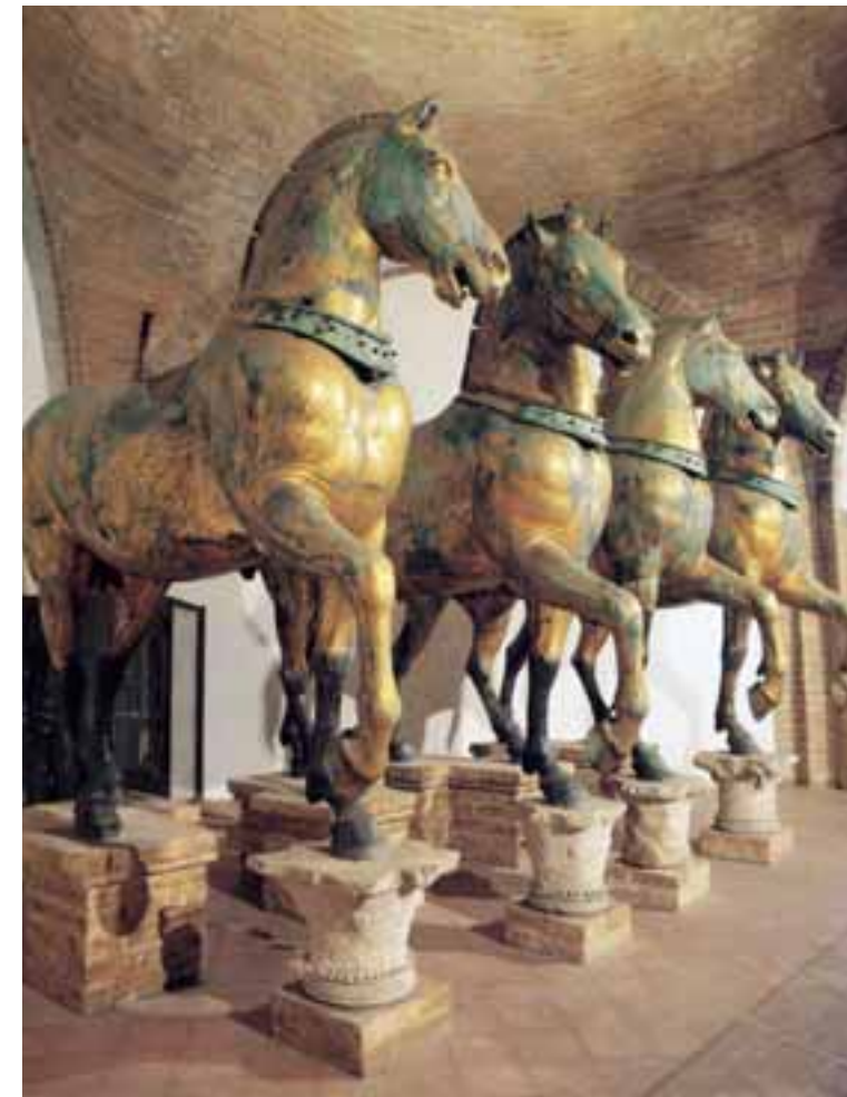
Čuvena četiri antička konja iznad glavnog ulaza u baziliku. U vrijeme 4. križarske vojne doneseni su u Veneciju kao ratni plijen. Godine 1797. g. Francuzi ih odnose u Pariz da bi na pročelje bazilike ponovo bili vraćeni 1815. g. nakon Napoleonova pada

Glavna doseljavanja u Mletke vezana su uz drugu polovicu 15. stoljeća. Najvećim dijelom useljenici su iz dalmatinskih gradova Zadra, Splita, Trogira, Dubrovnika, Šibenika, otoka, ali je i veliki broj došao iz Boke Kotorske. Dolaskom u Mletke Hrvati su se najviše bavili obrtničkim zanimanjima, pomorstvom, trgovinom... Bili su okupljeni u Bratovštinu sv. Jurja i Tripuna, koja je sve do druge polovice 19. st. imala hrvatska obilježja da bi od tada postala zajednicom istočno-