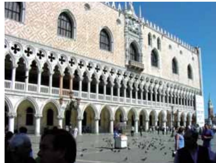
Duždeva palača potječe iz 16. st, a spoj je bizantske, gotičke i renesansne arhitekture; službena rezidencija 120 duždeva

Početak današnjih Mletaka valja tražiti u vremenu velike seobe naroda i provala Vizigota na područje današnje Italije početkom 5. stoljeća. Uz to je vezan legendarni osnutak Mletaka - petak, 25. ožujka 421. godine, a osam godina kasnije podignuta je i najstarija mletačka crkva S. Giacomo di Rialto. Masovno naseljavanje Lagune počelo je 568. g. provalom Langobarda.