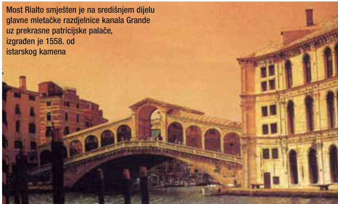
Most Rialto smješten je na središnjem dijelu glavne mletačke razdjelnice kanala Grande uz prekrasne patricijske palače, izgrađen je 1558. od istarskog kamena