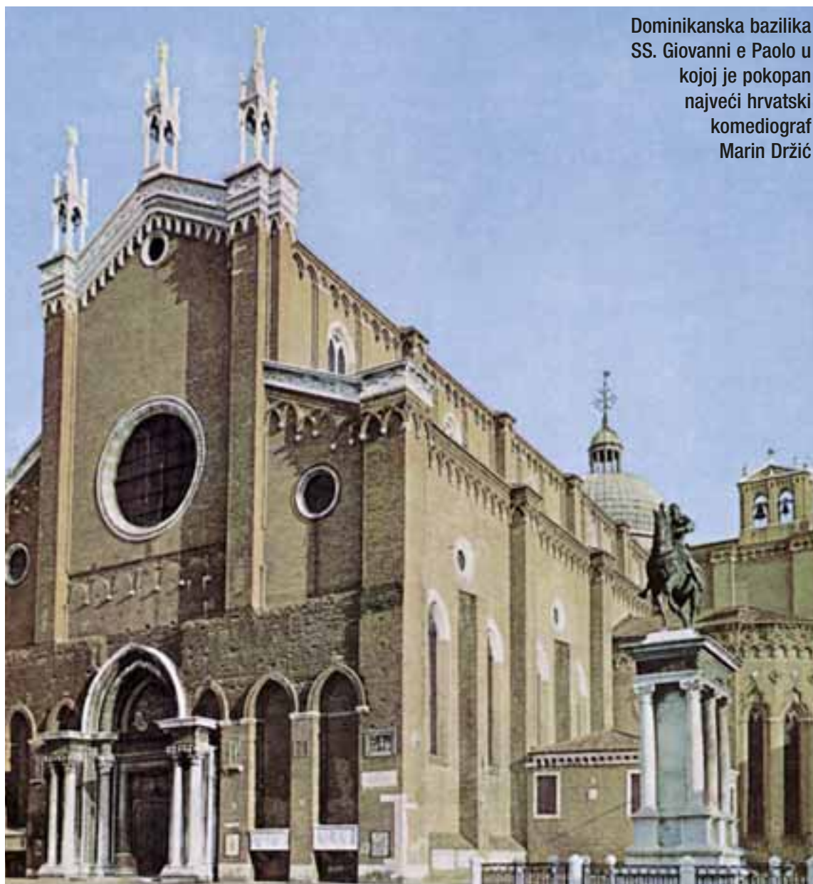
Dominikanska bazilika SS. Giovanni e Paolo u kojoj je pokopan najveći hrvatski komediograf Marin Držić

“ Djela ondašnjih vodećih hrvatskih pisaca Marulića, Gundulića, Držića, Zoranića, Lucića, Zlatarića i dr. ugledala su po prvi put svjetlo dana kod znamenitih mletačkih nakladnika